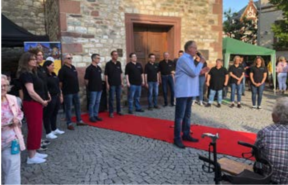
Inthronisierungsfeier Bembelfee 2022

Rembser's Wurst- und Fleisch-Center Das Beste vom Erzeuger für den Verbraucher Qualität aus Tradition