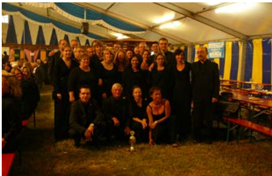
Chorwettbewerb -Musica Sacra- Oberndorf 2011

Fa. Karl Schmidt Telefon: 0611 / 503900 Raiffeisenstraße 21 Mobil: 0179 / 5114316 65191 Wiesbaden E-Mail: schmidt-shk@t-online.de