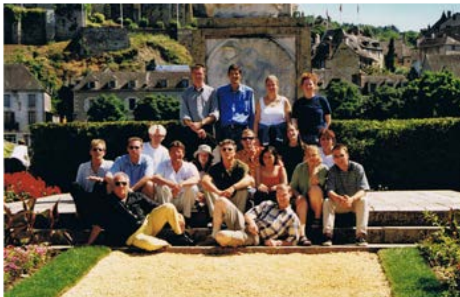
Konzertreise Ile d'Oleron und Terrasson 2000