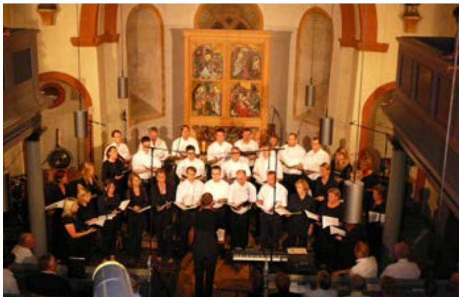
MGV Festtage 2008

Mo-Fr: 9.00 – 13.00 Uhr 15.00 – 18.00 Uhr Sa: 9.00 – 13.00 Uhr