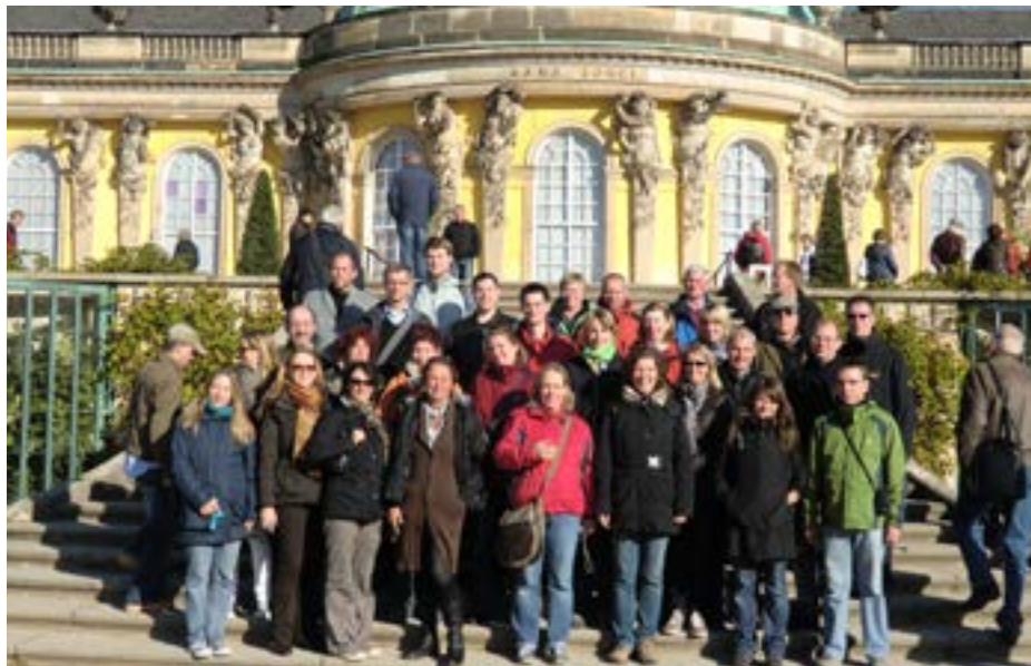
Sängerfahrt Berlin 2011